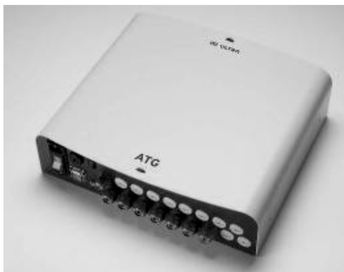
Kućište 2 Slika 4